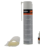
Artikel code 013690 CLEANING KIT (EXCL. FILTER & O-RING)