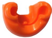
Artikel code 902425 WERKSTUK BESCHERMDOP IM65A F16 (LITHIUM)