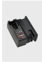
Artikel code 018881