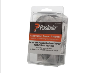
Artikel code 900507 CAR ADAPTER 12V - PULSA / IMPULSE