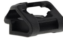
Artikel code 018930 WERKSTUK BESCHERMDOP - IM65A F16 (LITHIUM) -PARKET